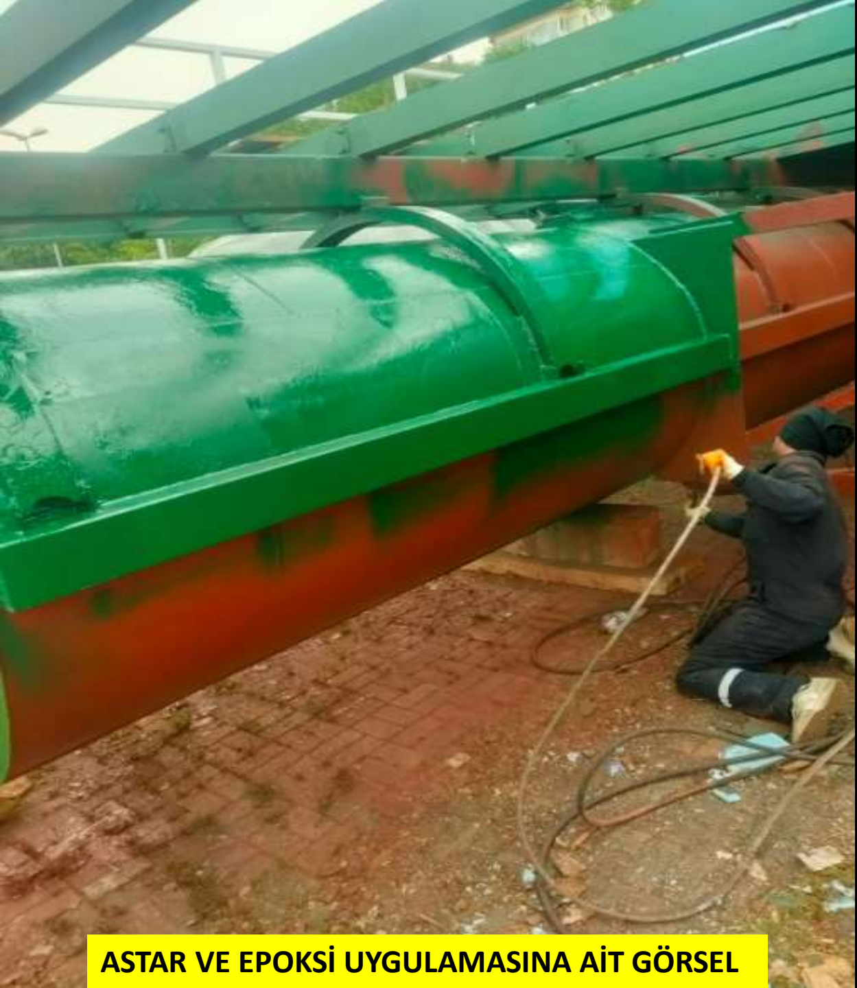
ASTAR VE EPOKSİ UYGULAMASINA AİT GÖRSEL