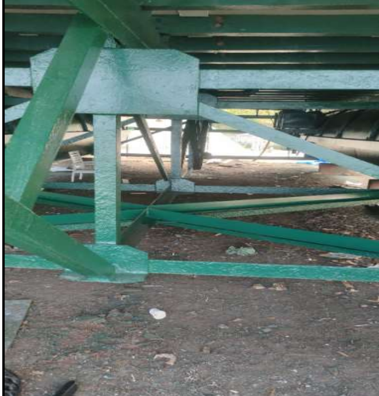
100 x 100 mm L KÖŞEBENT İLE DÜŞEY KONSTRÜKSİYON GÜÇLENDİRME ÇALIŞMASI