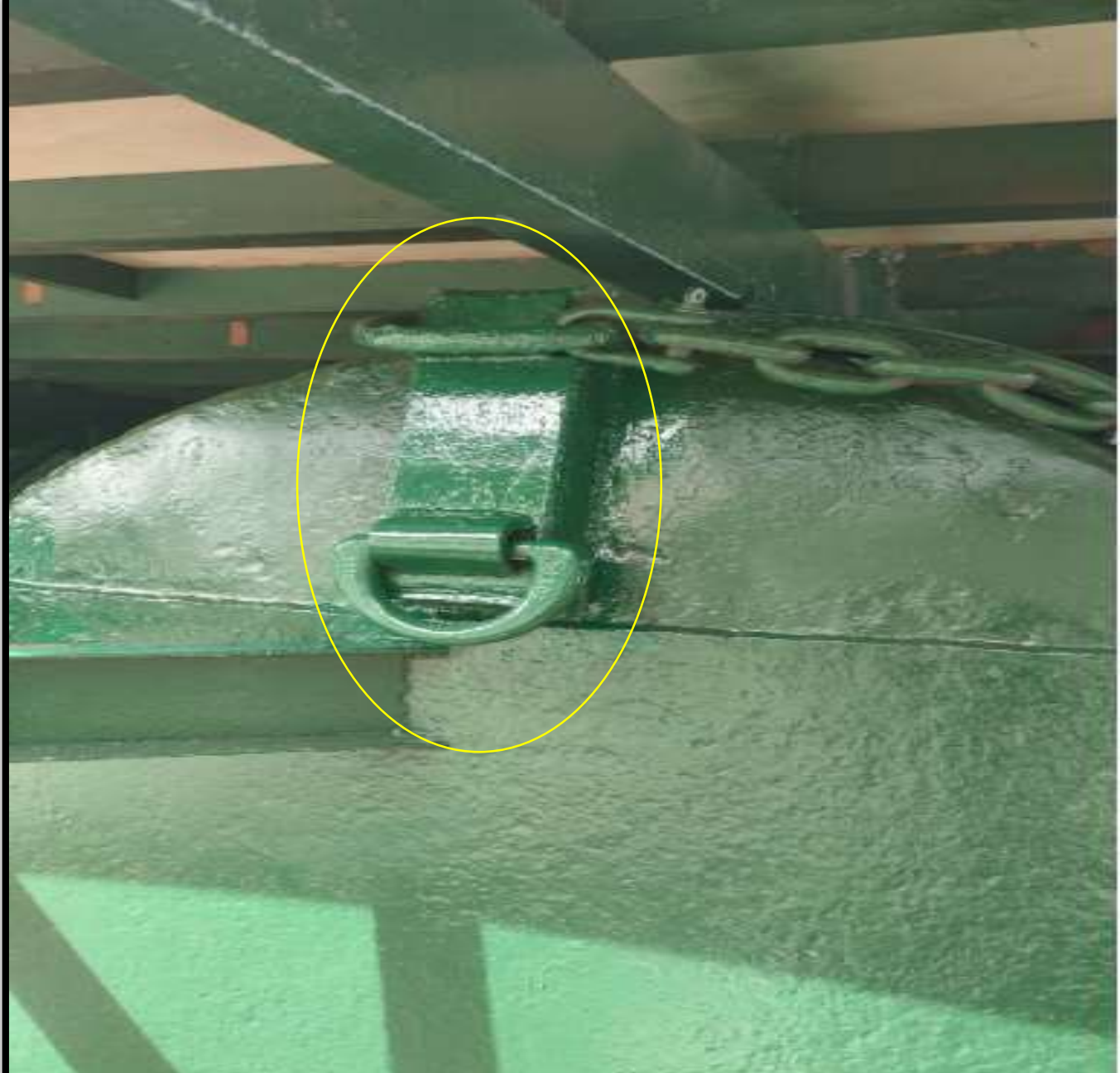
DABLİN VE HALKA KAYNAĞI İŞLERİ SONRASI ASTAR VE EPOKSİ BOYA UYGULAMASI GÖRSELLERİ