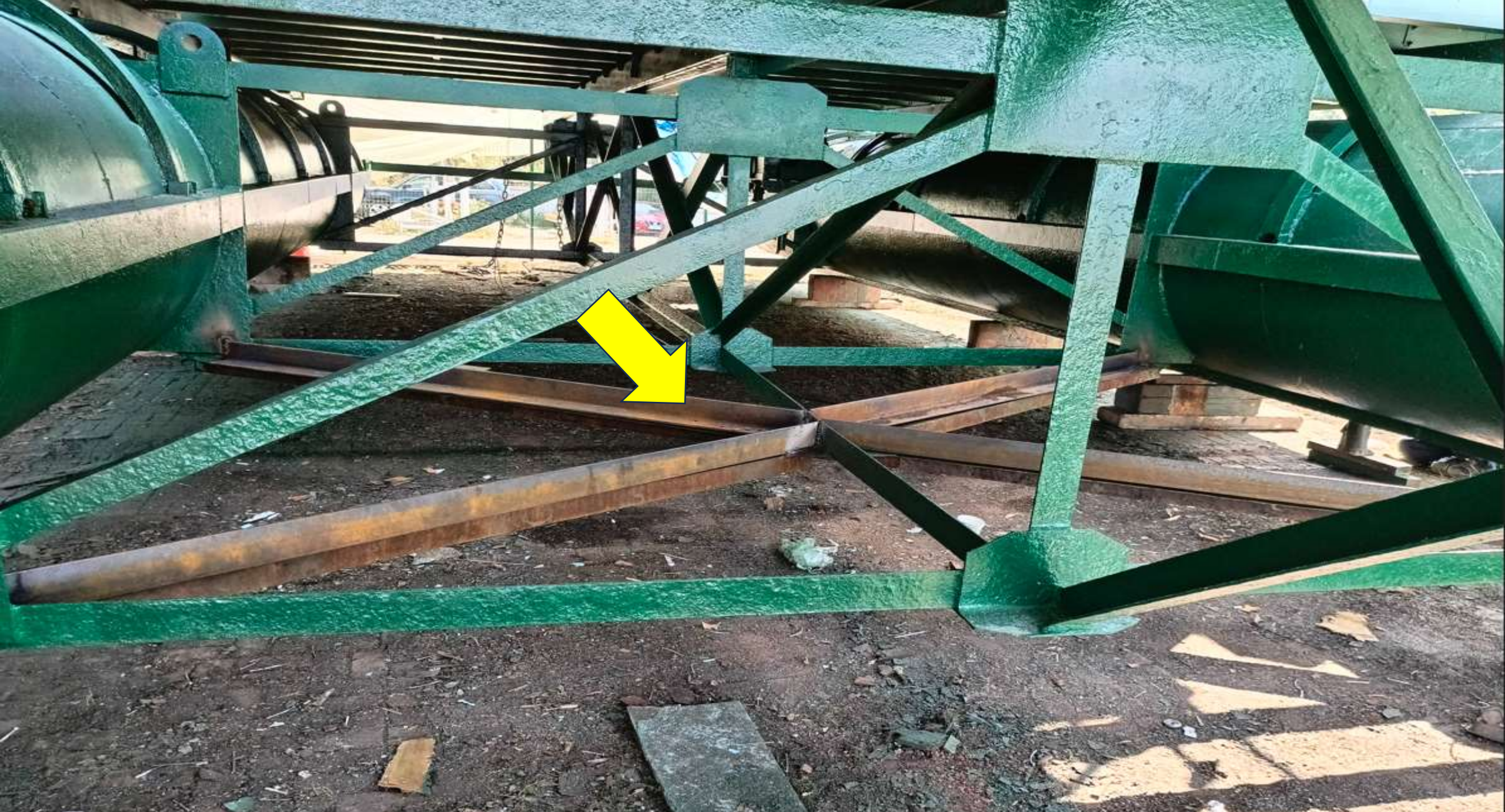
100 x 100 mm L KÖŞEBENT İLE DÜŞEY KONSTRÜKSİYON GÜÇLENDİRME ÇALIŞMASI