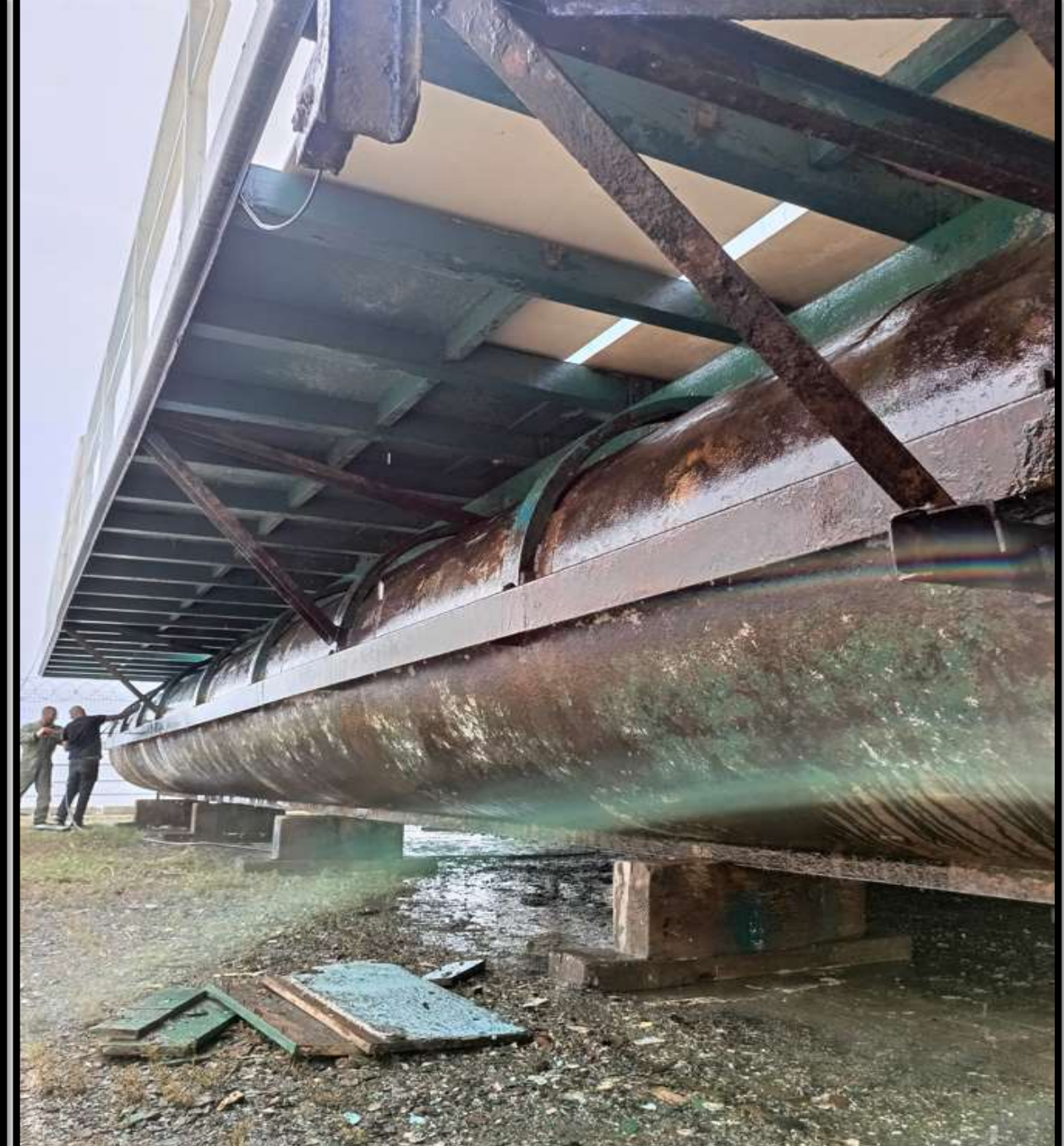
SU RASPASINA AİT ÇALIŞMA